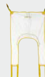
Réf. 20014 Sangle en U (filet)