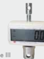
Modèle médical classe III