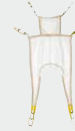
Réf. 20016 Sangle en U avec têtière (filet)