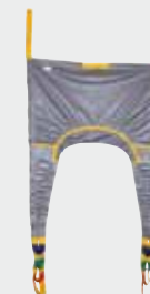
Réf. 20015 C Sangle en U confort