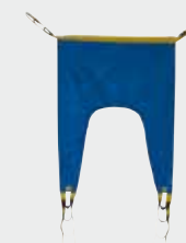
Réf. 20042 Sangle en U standard (bâche bleue)