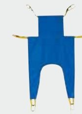
Réf. 20043 Sangle en U avec têtière (bâche bleue) enveloppante