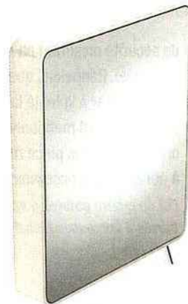
▲ Miroir inclinable Hewi (Richardson)

Miroir basculant salle de bains PMR, 400 € TTC (Tous Ergo); miroir orientable multidirectionnel Pellet, 290 € TTC (Richardson, Tous Ergo); miroir inclinable Hewi, 750 € TTC (Richardson)