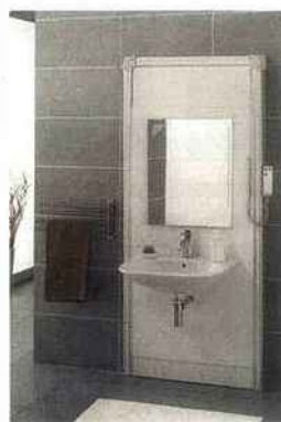
Lavabo sur châssis réglable de marque Sfa (Richardson)

Pour une polyvalence d'utilisation, transformer l'installation existante en une à hauteur variable sera à envisager. Ce type d'aménagement passe par la fixation d'un support mural de lavabo (jusqu'à 25 kg),