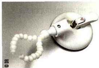
Poignée à ventouse (Mobeli)

Que ce soit dans la salle de bains, les sanitaires ou encore la cuisine, nous avons déjà vanté à plusieurs reprises l'intérêt des poignées et barres à fixation à ventouses, en particulier le système Mobeli en raison de sa sûreté d'utilisation (indicateur de sécurité mesurant en permanence la force d'adhésion de la ventouse). Rappelons quelques atouts : aucuns travaux, possibilité de repositionner à volonté la ventouse. Outre la fonction de porte-miroir précédemment mentionnée, les supports à ventouses dotés d'un crochet ou d'une pince représenteront des aides utiles pour garder à portée divers accessoires de soins, sèche-cheveux par exemple.