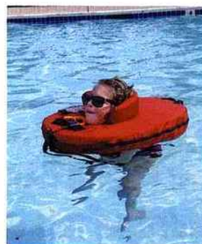
▲ Modèle Lj-A (Importateur Marconnet Technologies)

Le Lj-A - Quant au Life Jacket Adapted (Lj-A) ou "veste de survie adaptée", son emploi confère au corps une tenue droite