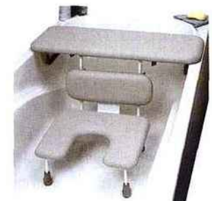
▲ Combiné siège de bain et planche, Ascot

une planche à trois points d'appui sur le rebord à positionner en bout de baignoire. Pas de poignées ici mais deux encoches, dessinées dans le cœur de la tablette, pour se tenir. Un tel design vise à éviter le risque de basculement arrière et à laisser un maximum d'espace pour l'enjambement. Autre possibilité pour un accès facilité, la planche de bain muni d'un disque de transfert pivotant à 360° et à coulissement latéral.