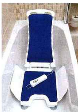
▲ Siège de bain élévateur Bellavita Classic, Identités