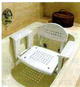
▲ Siège de bain Profilo, Identités

Sièges de bain à dossier, de 70 à 100 € (Tous Ergo, Identités, Invacare); siège de bain élévateur Bellavita, 545 € (Identités)