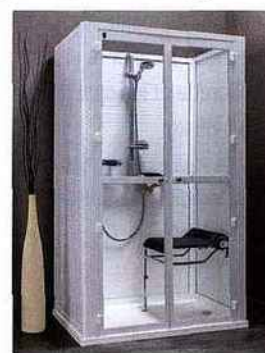
▲ Sièges de douche rabattable, Idhra Vichy

Tabourets et sièges de douche fixes, de 45 à 150 €, ou rabattables, de 140 à 440 € (Identités, Idhra Vichy, Invacare, Tous Ergo)