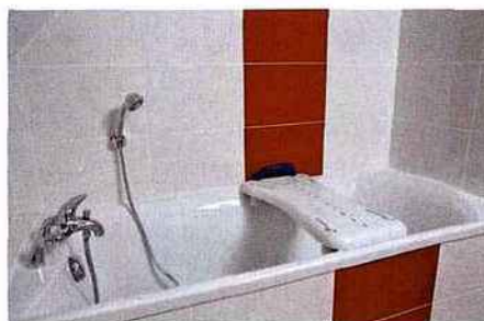
▲ Planche de bain Eco, Identités

Les classiques proposent une poignée ergonomique (parfois deux) sur laquelle l'utilisateur prend appui pour réaliser un transfert. Le réglage peut s'effectuer à l'aide de fixations coulissantes ou, pour une stabilité accrue, de ventouses à verrouiller/déverrouiller. Il existe aussi